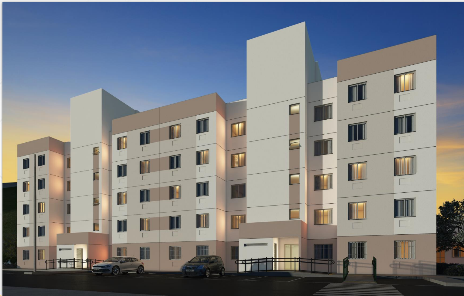
FACHADA DE APTO 2QUARTOS